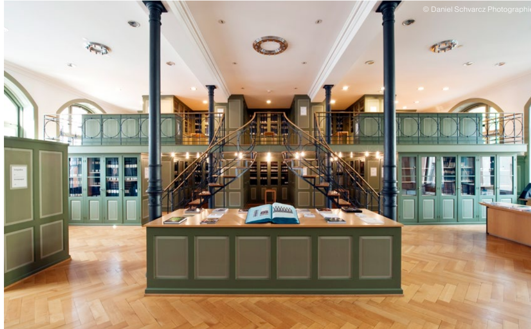
LA BIBLIOTHÈQUE DU MUSÉE DU TEXTILE EST UNE MINE INÉPUISABLE D'IDÉES.

Plongez dans l'esprit avant-gardiste et la tradition! Les offres du Textilland Ostschweiz vous donnent accès à notre riche patrimoine textile.